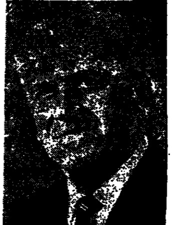
يقلم : يعقوب يهوشع

وكان بدل الاشتراك في فلسطين وشرق الأردن معا جنها ونصف في الخارج (أي البلاد العربية اوروبا وغيرها) جنينين